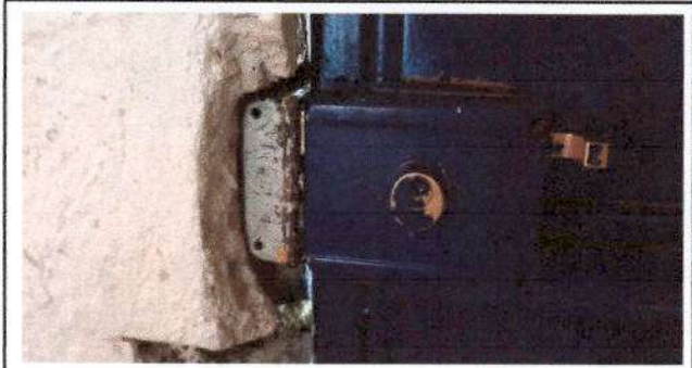
Foto1: sustitución de chapas de puertas de aulas de la Escuela.